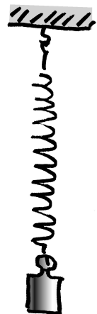
Abb. 1. Hängt an der Feder eine Masse? Hängt an der Federkonstante ein Körper?

Viele andere gebräuchliche Formulierungen enthalten dieselbe Unstimmigkeit: „In den Stromkreis wird eine Kapazität eingebaut,“ statt „In den Stromkreis wird ein Kondensator eingebaut“, „Das Filter lässt nur die kurzen Wellenlängen durch“ statt „Das Filter lässt nur Licht kurzer Wellenlängen durch“ oder „Das Gas befindet sich in einem zylinderförmigen Volumen“ statt „Das Gas befindet sich in einem zylinderförmigen Behälter.“ Wie eine mathematische Variable nicht hängen kann, so kann man sie auch nicht in einen Stromkreis einbauen, sie kann nicht durch ein Filter hindurchgehen und sie kann nicht zylinderförmig sein.